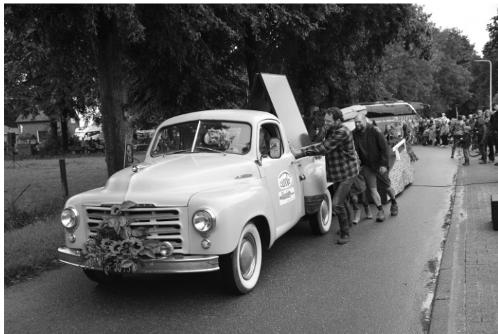
Optocht 2023: Grote variatie, ook in aandrijvingskracht

Kijk verderop in het krantje voor meer informatie.